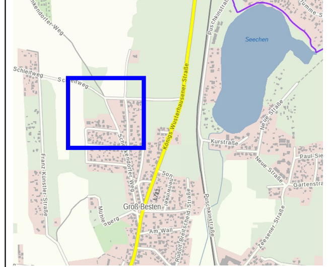
Übersichtskarte Auszug: Brandenburg Viewer